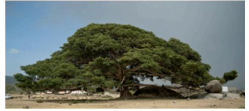
Ivo Kocherscheidt: Giant Sycamore Tree bei Adi Keye, Eritrea, 2010